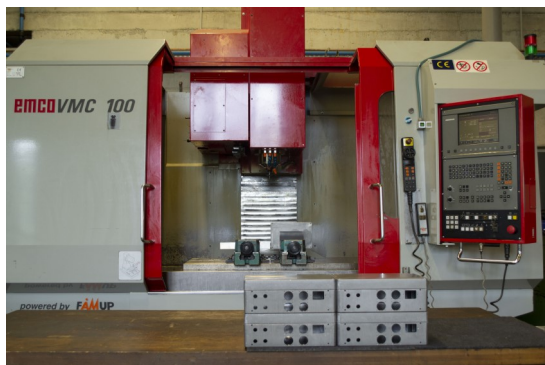
Emco VMC 100