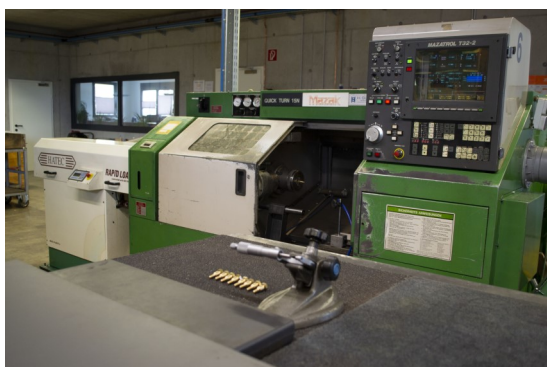
Mazak Quick Turn 15 N