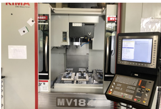
Quaser MV 184P