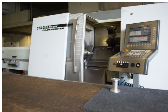
DMG CTX 420 linear