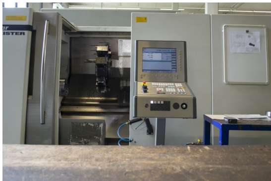
DMG CTX 420 linear