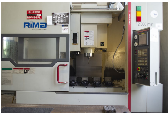
Quaser MV 154 PL