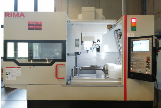
Quaser MV 184 E