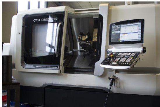
DMG CTX 2500/ 700