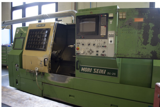
Mori Seiki SL 25 CNC